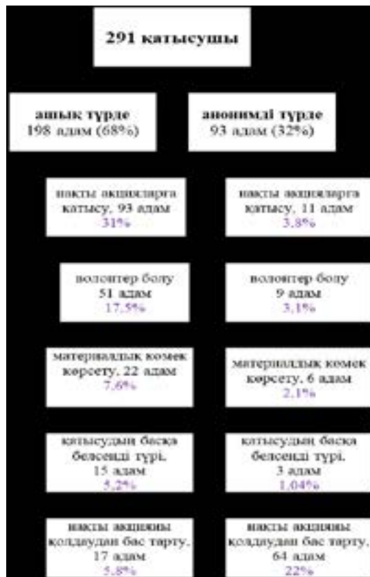
2-кесте. Сауалнамаға қатысушыларды қоғамдық іске қатысу формалары бойынша бөлу

шынайы өмірдегі іс-әрекеттерге қатысуға деген ұмтылысы төмен болады.